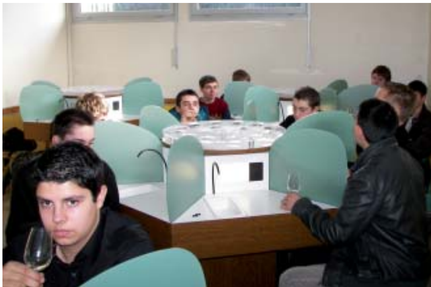
Les jeunes utilisent déjà la nouvelle salle.

Le plus important sur cette 3 e phase est d'évaluer l'équilibre