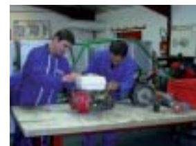
Les stagiaires passent des heures à fiagner les buggies.

Le CFA de la MFR « La Rousselière », à Montreuil-Bellay, forme les jeunes aux métiers de la mécanique automobile et de la mécanique agricole. Nombre de jeunes choisissent cette MFR pour apprendre la mécanique dès la classe de 4 e . L'ensemble des stages réalisés par les jeunes se font en garages automobiles.