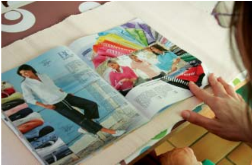
Les filles de la Maison Familiale de Noyant sont branchées mode et suivent les tendances sur Internet.

forme, les matières k-way sont de retour, on joue sur des découpes graphiques, sur des matières en 3D et sur la transparence.