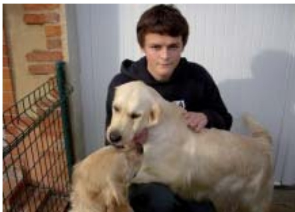
Heureusement tous les chiens ne servent pas à pêcher les requins.