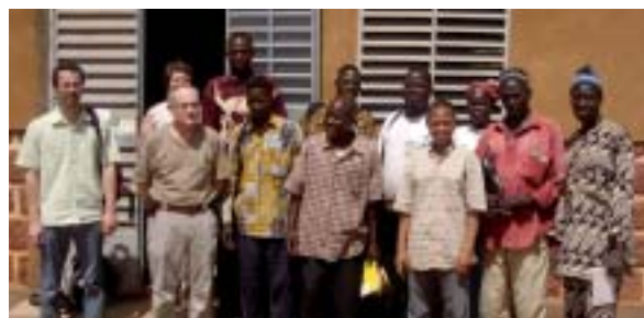
Février 2009 : Rencontre à la MFR de Yako.

- Des sessions d'alphabétisation inscrites dans les programmes nationaux burkinabé. Depuis quelques années, ces formations bénéficient de financements contractualisés au Burkina Faso.