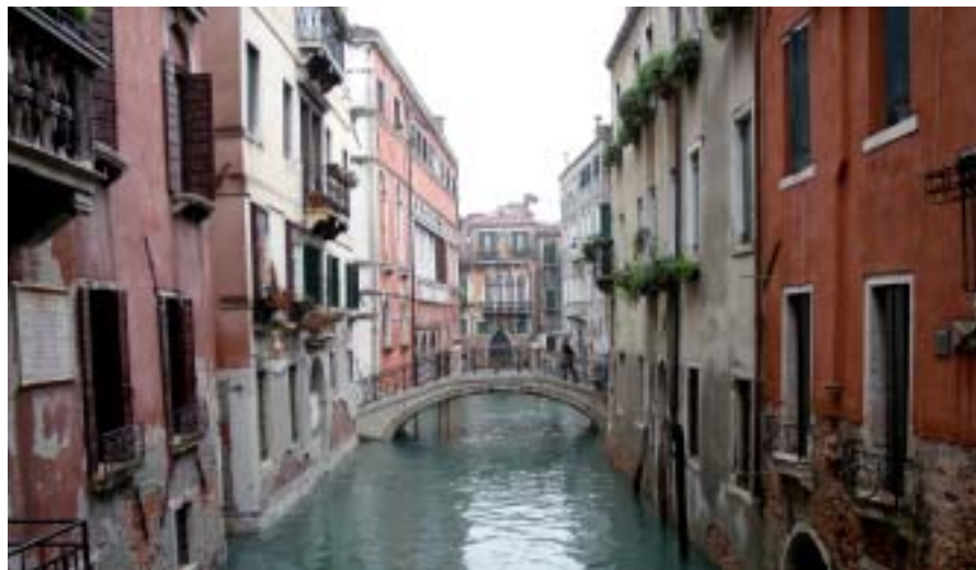
Les canaux et les gondoles font toujours rêver.

Les élèves de Terminale Bac Pro de l'Institut de la Pommeraye ont déposé leurs bagages en provenance d'Italie et du Pays de Galles et sont revenus la tête pleine de souvenirs! Afin de faire partager leurs expériences, les familles étaient invitées à la soirée d'échanges culturels le 3 décembre 2009.