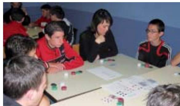
Des veillées qui nous ressemblent.

À la Maison familiale rurale de Segré, la moitié des jeunes sont internes. Les soirées étaient parfois longues, même avec des veillées. Tout a changé depuis que les jeunes les organisent eux-mêmes.