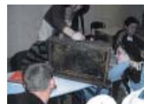
Que serait notre jus d'orange sans les abeilles ?

Grâce à lui, les élèves ont compris pourquoi les abeilles sont importantes : sans elles, a expliqué l'apiculteur, notre petit-déjeuner ne serait pas aussi complet... Quel lait boirait-on si les vaches ne pouvaient plus manger d'herbe ? De quoi serait fait notre jus