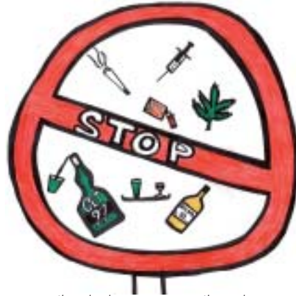
La consommation de drogue : une pratique dangereuse. Dessin de Guillaume.

ressentir des instants euphoriques et 20 % car ils sont mal dans leur peau et ne veulent pas se sentir écartés. Pour la plupart (90 %), les jeunes boivent lors des fêtes entre amis, pour des anniversaires ou autres réceptions et 10 % boivent régulièrement voire systématiquement sans