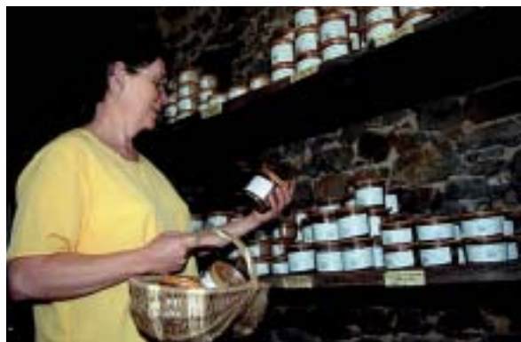
Apprendre à mieux se nourrir avec des produits naturels

Destruction de la couche d'ozone, banquise menacée, déforestation organisée : ces bouleversements mondiaux ont une incidence directe sur notre alimentation journalière.