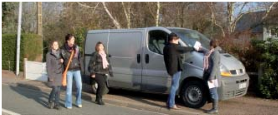
Les élèves de la Meignanne posent des smileys d'avertissement sur les pare-brise des voitures mal stationnées.

Une campagne de prévention a été lancée dans la commune de la Meignanne car trop d'automobilistes se garent sur les trottoirs et gênent le passage des piétons. Le but est de poser des Smiley sur les pare-brise pour prévenir et faire évoluer les comportements.