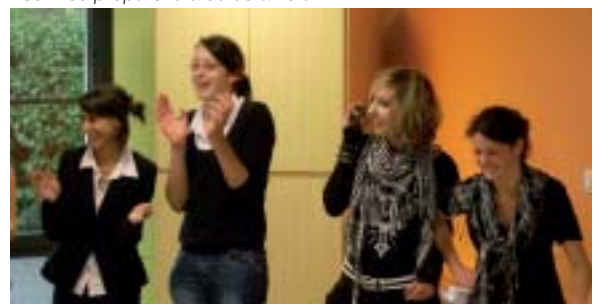
Les filles préparent la sortie à vélo.

Classes de Seconde Conseil Vente et BEPA 1 Services aux Personnes.