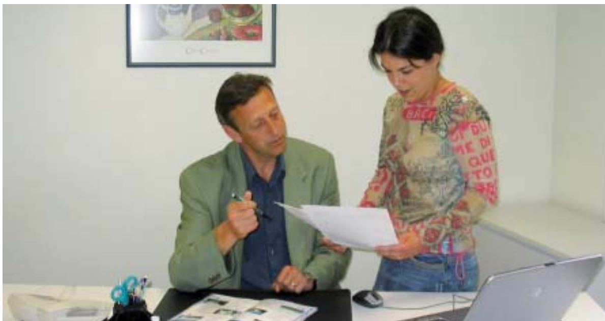
L'accord implicite entre le maître de stage et le stagiaire est un atout supplémentaire.

Le stage est une phase très importante dans le parcours de formation. L'objectif est d'avoir une vue d'ensemble de l'entreprise et de participer aux différentes tâches.