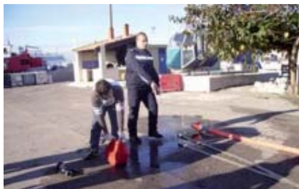
Les marins pompiers de Marseille ont montré leur savoir-faire.

Les élèves de 3 es de La Romagne ont séjourné en camping du 30 novembre au 2 décembre 2009 à Marseille, la ville de l'OM et de sa devise « En avant ». Les objectifs de ce voyage sont de développer l'autonomie, puis de poursuivre la cohésion de groupe tout en approfondissant les projets professionnels individuels.