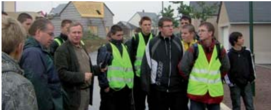
Les jeunes ont visité l'éco-lotissement de Forges

Suite à la réforme des formations et la mise en place du Baccalauréat Professionnel « Conduite et Gestion de l'Exploitation Agricole spécialisé - Grandes cultures céréalières » en 3 ans (unique en Pays de la Loire), une semaine liée au développement durable a été organisée à la MFR de Montreuil.