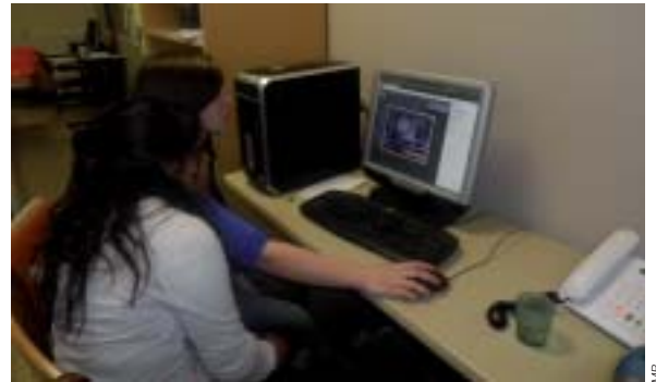
Recherches de décorations pour la veillée « Qui veut gagner des millions ? »

Au sein de la Maison Familiale Rurale, des veillées sont organisées chaque soir. Des élèves de quatrième ont proposé de mettre en place une veillée « Grand jeu ». Le jeu en question « Qui veut gagner des millions ? ».