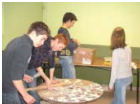
Les 4 e de la MFR de Segré se découvrent de nouvelles compétences.