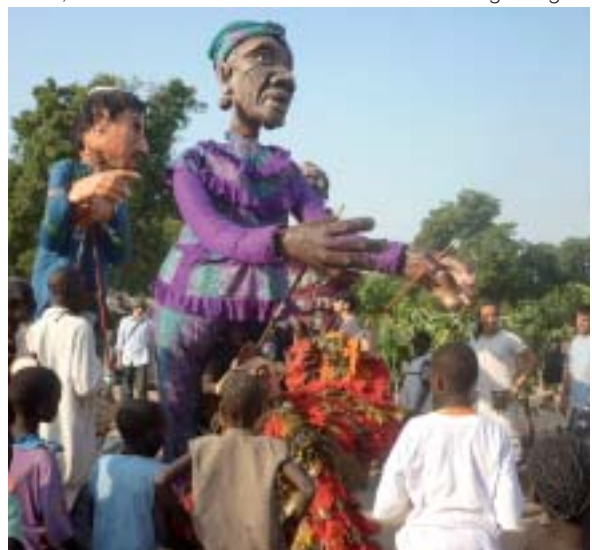
Tous entrent dans la danse.