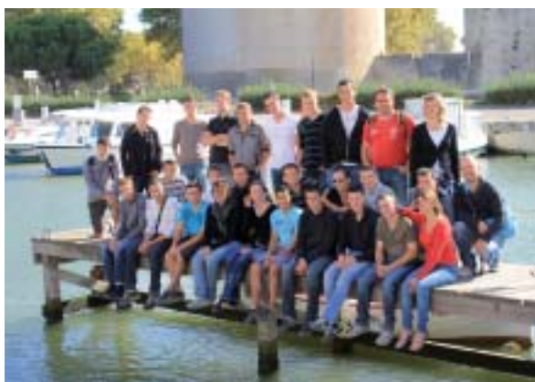
Le groupe de BTSA ACSE.

Les apprentis ont pu aussi observer des secteurs d'activités agricoles très différents