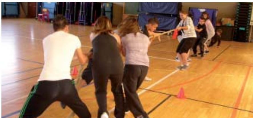
Quelle équipe tirera le plus fort ?