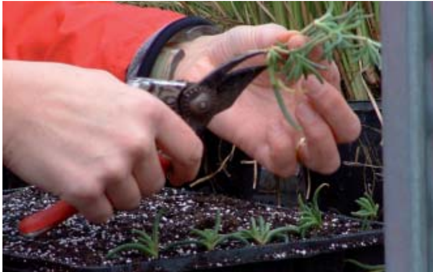
le sécateur, un outil pas si simple à manier.

Certains gestes simples peuvent diminuer les problèmes de dos. Il faut alterner les positions