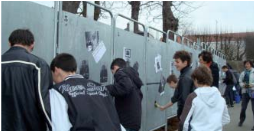
Les jeunes de 4 e s'initient à l'art.