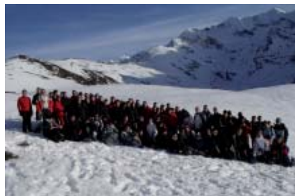
Balade en raquettes sous un beau soleil.

Au programme : découverte d'une autre région, d'une autre agriculture et du ski.