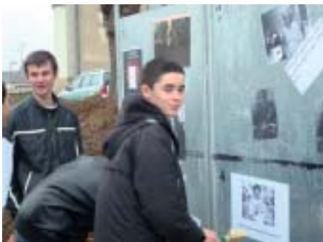
Les jeunes de la MFR de Beaupréau ont questionné les anciens.