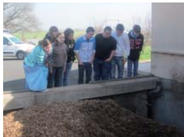
Découverte de la chaudière par les 3 e .

Les énergies renouvelables sont une priorité à la MFR Le Vallon. Elles ont leur place au programme et dans l'établissement. Les élèves de troisième ont étudié le système de chauffage de la Maison Familiale Rurale Le Vallon : la chaudière à bois.