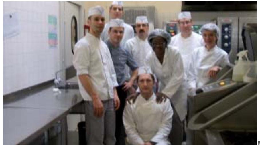
Quelques stagiaires du groupe Cuisinier Gestionnaire ont préparé 290 repas avec des produits du terroir.

Le Centre de Formation de Jallais a accueilli près de 500 personnes lors de l'événement « Bien dans son assiette » organisé en partenariat avec le CRDA des Mauges et le Centre Permanent d'Initiatives pour l'Environnement (CPIE). L'ensemble des acteurs du Centre de Formation et, notamment, les stagiaires se sont mobilisés sur une journée, point d'orgue de la manifestation sur site. Les cuisiniers gestionnaires ont confectionné