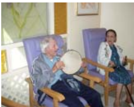
La musicothérapie pour se détendre et réduire le stress.