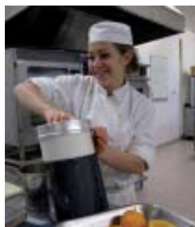
Réalisation de la sauce vinaigre et orange.