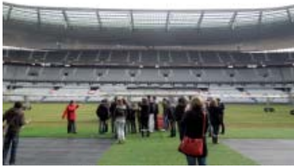
Visite du stade de France

Les vingt-six jeunes en classe de 3 e ont passé quelques jours à Paris, les 22, 23 et 24 Février. Ces trois jours ont été marqués par différentes visites répondant à des objectifs de découverte et de sensibilisation à l'histoire de l'art.