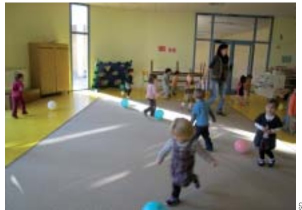
Séance de motricité.

Elle assiste le personnel enseignant dans les écoles maternelles pour toutes les activités qui n'ont pas un caractère scolaire. De qui parle-t-on ?