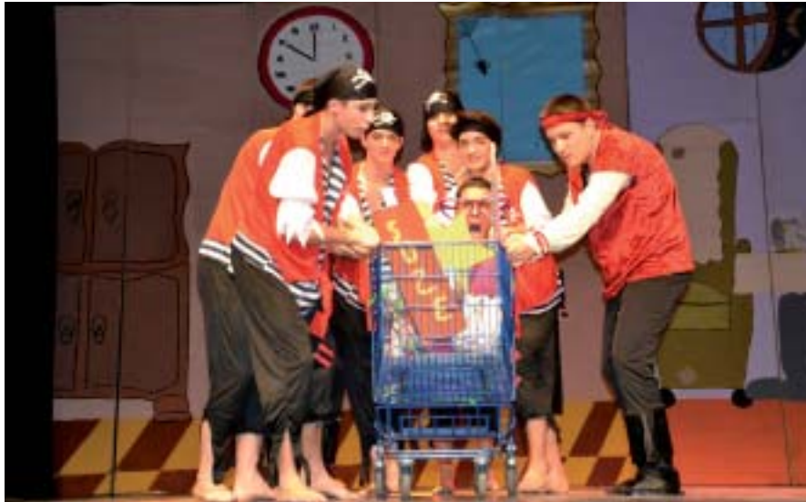
La fée clocharde piégée dans un Caddie.

Depuis le début de l'année, chaque vendredi après-midi et ce jusqu'au jour « J », les jeunes étaient divisés en plusieurs groupes de travail : trois groupes « décoration », six groupes « danse », un groupe « communication » puis un groupe « théâtre ». Les formateurs encadraient ces différents