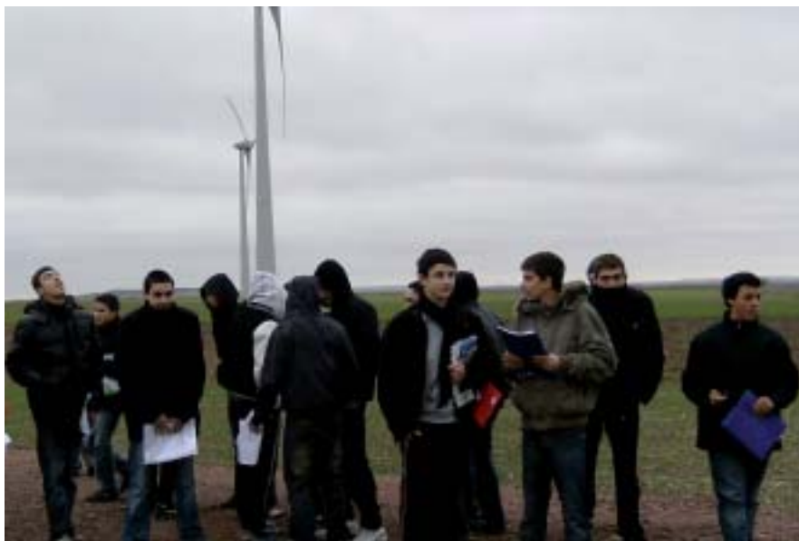
Les jeunes au pied de l'éolienne.

Les jeunes se sont déplacés sur le site éolien d'Antoigné, village de 480 habitants tout proche de Montreuil Bellay pour découvrir le fonctionnement des 4 éoliennes du sud saumurois. D'abord impressionnés par leurs grandeurs, les jeunes ont pu être guidés par le maire de la commune qui a su expliquer l'arrivée et l'implantation de ces colossales tiges métalliques. Visibles de plusieurs kilomètres à la ronde, même par temps de brouillard, ces moulins à vent ultra-modernes de 125 mètres de haut sont en