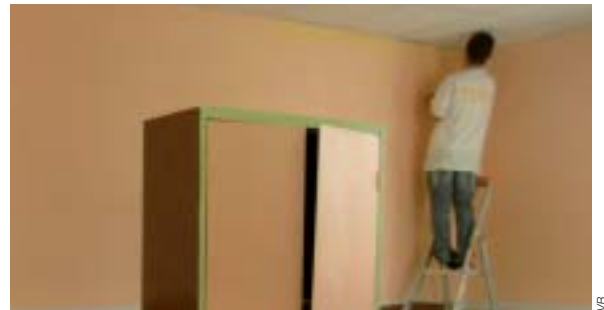
En plein travail !

Avant leurs quatorze ans, les élèves ne peuvent pas faire de stage. Ils sont donc pris en charge par la maison familiale. À Gée, ce fut le cas de quelques quatrièmes et une troisième. Ils ont répondu aux questions de leurs camarades :