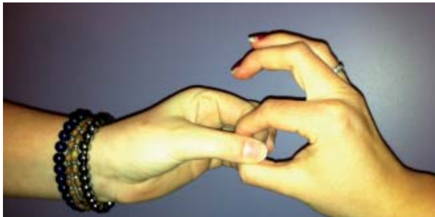
Le signe « unie » en langue des signes !

S. : Au Cèdre, non, j'ai seulement des interprètes de temps en temps. Dans ma vie personnelle, oui, j'ai de nombreuses choses adaptées (ex : dans ma voiture, il y a un miroir entre les deux sièges...)