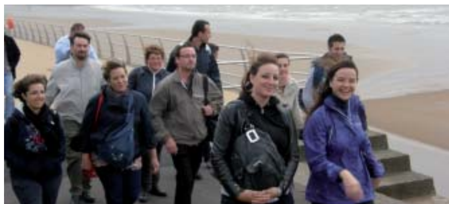
Visite guidée de Swansea : centre, port et plage.

Les stagiaires « tourisme » CFP des MFR Gennes.