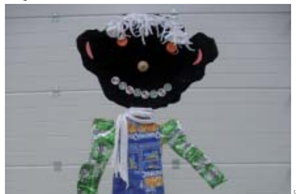
Donner une seconde vie à des déchets.

Les Terminales Bac Pro Agroéquipement MFR de Chemillé.