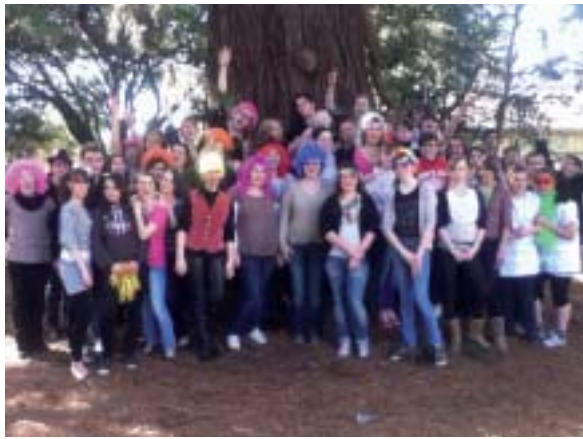
Les secondes Bac Pro SAPAT avec leurs administrateurs (à droite).

À la MFR du Cèdre, les internes ont également créé leur lip dub, ils ont choisi la musique (les