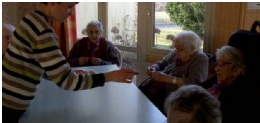
Un temps d'échange intergénérationnel.