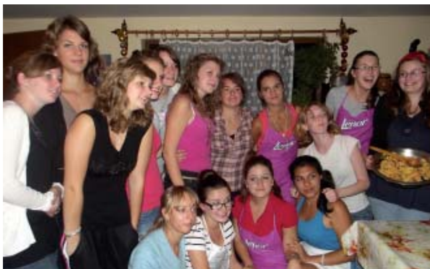
A la découverte des Roumains.

Lors de l'atterrissage à Cluj Napoca, quelle a été la surprise de la classe d'arriver dans une ville dynamique aussi grande que Nantes, remplie d'étu-