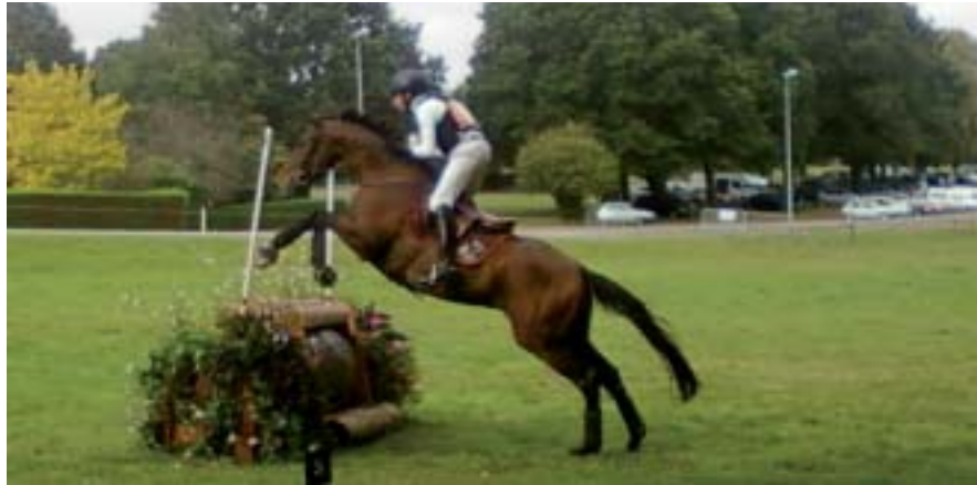
Concours complet d'équitation - épreuve du cross.

Le but de cette rencontre était de montrer la complexité de l'organisation d'un CCE (concours complet d'équitation) et de participer à cette action en temps que bénévole. Un CCE est la discipline équestre la plus spectaculaire. Elle se compose de trois épreuves bien distinctes qu'un cavalier doit effectuer avec le même cheval: dressage, cross, saut d'obstacle. Pour la préparation, les élèves ont effectué diverses activités comme :