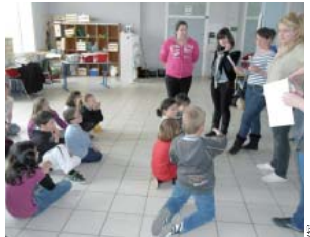
En animation, devant un jury exigeant.

Pour valider des compétences liées à la petite enfance et obtenir leur diplôme, les CAPA SMR (Services en Milieu Rural), sont partis 4 jours à Brétignolles sur Mer.