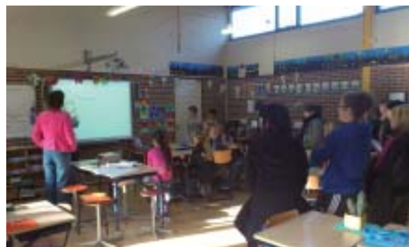
Visite d'une classe équipée d'un tableau interactif.

Durant une semaine, les élèves de BEPA à la MFR de La Pommeraye ont découvert les paysages du pays et apprécié ses spécialités.