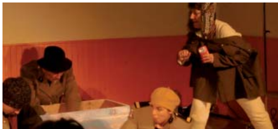
La découverte du colis !