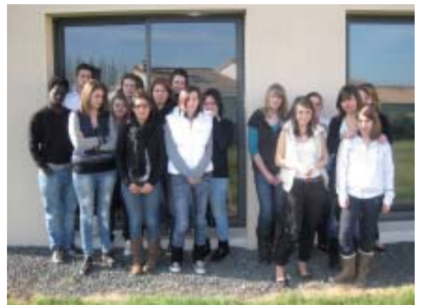
La classe de seconde SPT à la sortie de la halte garderie.

La classe de Seconde SPT - MFR La Romagne.