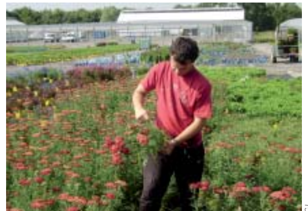
Etre actif sur le terrain.

Dernière ligne droite jusqu'à l'examen, l'occasion pour les CAPA 2 de faire le bilan. Pour la plupart d'entre eux, il n'a pas été difficile de faire le choix de l'alternance. L'envie d'être actif sur le terrain l'emportait largement sur la motivation pour rester dans une salle de cours.