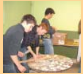
La mosaïque des 4 e de la MFR de Segré.

Formation « loisir » : les élèves de 4 e ont habillé des « tourets en bois » en mosaïque en groupes de quatre.