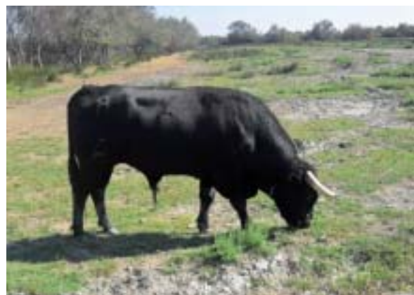
Bien paisible ce « Brave » !

dans ce cadre que le groupe a rencontré M. Riboulet, éleveur de taureaux de race « Brave », destinés à la tauromachie. Son élevage fut une véritable ouverture et découverte pour les jeunes éleveurs du groupe. En effet, les critères de sélection sont essentiellement basés sur la bravoure et la combativité des animaux pour que ces derniers soient ensuite en mesure