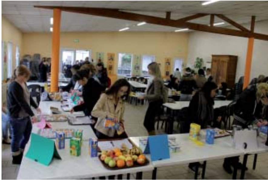
Les jeunes de la MFR préparent leur plateau d'énergie et de convivialité!

Certains devaient être présents pour la mise en place du buffet (des affichettes correspondant aux groupes d'aliments avaient été illustrées) ainsi que pour l'organisation de la salle de restauration. D'autres étaient chargés de ranger et nettoyer