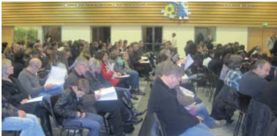
De nombreux participants à cette AG bien animée.