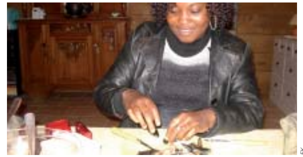
Dégustation de moules de l'Atlantique. Le mollusque fut plus apprécié que les huîtres !

Je me suis très vite accommodée aux différents repas. J'ai même goûté aux huîtres, aux moules, à une diversité de vin (les vins d'Anjou) et de très bons chocolats. La France possède de très belles églises (Église de St Florent le Vieil,