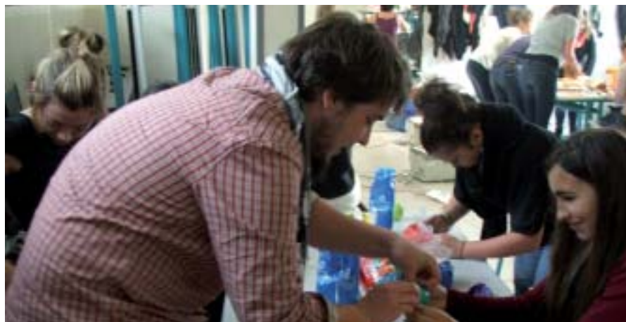
Les Terminales SAPAT en session BAFA.

Bac Pro SAPAT 1 res et Terminales. MFR La Pommeraye.