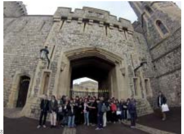
Les apprentis devant le château de Windsor, avant la visite guidée.

ries-pâtisseries artisanales (Hockley Heath), des palaces et restaurants de luxe à Londres comme le Ritz ou le Hilton, quelques jeunes, les yeux remplis d'étoiles, ont exprimé le souhait de travailler comme serveur, pâtissier ou cuisinier chez nos amis britanniques : une vraie opportunité pour ces jeunes lorsque l'on sait que le secteur de la