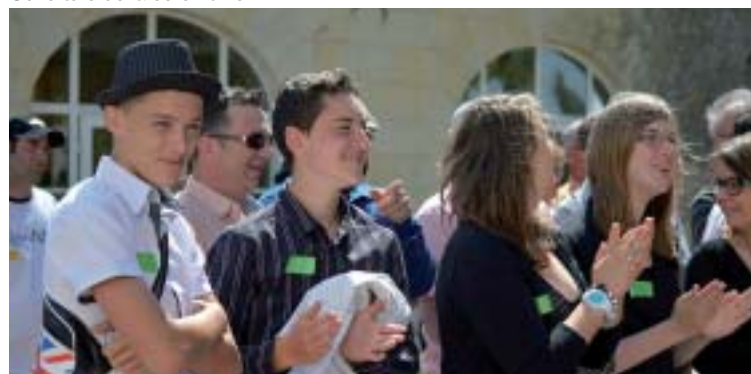
Les élèves aussi de la fête

lité. Les élèves présents ont pris plaisir à servir les invités, à discuter avec eux, à leur faire visiter les locaux et entendre des anecdotes de camaraderie. Les élèves présents ont été agréablement surpris : « On ne croyait pas qu'il y aurait autant de monde ! »