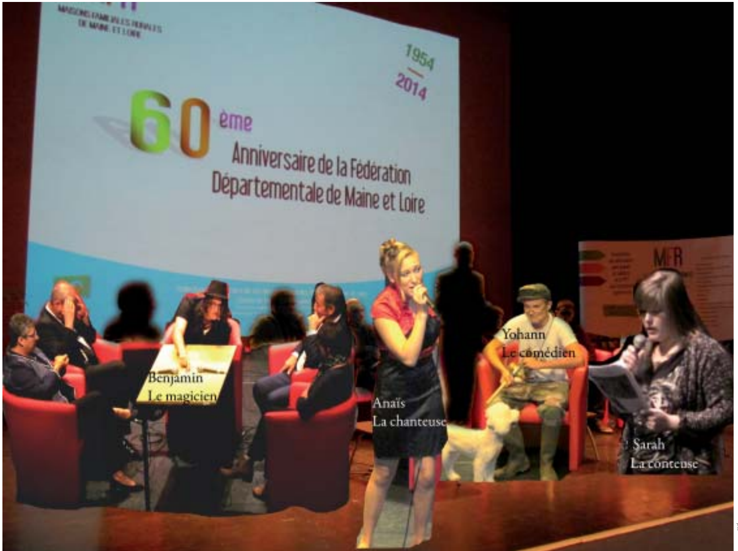
Les jeunes ont présenté leur talent.