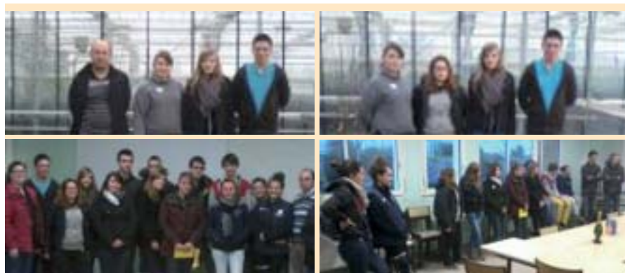
Les diplômés des productions horticoles ont reçu leurs médailles.

Amélie N., Elodie B., ainsi qu'Eloïse B. et Etienne R., élèves des classes de 2 de , 1 re et CAPA 2 en production horticole de la Maison Familiale de Chalonnnes.