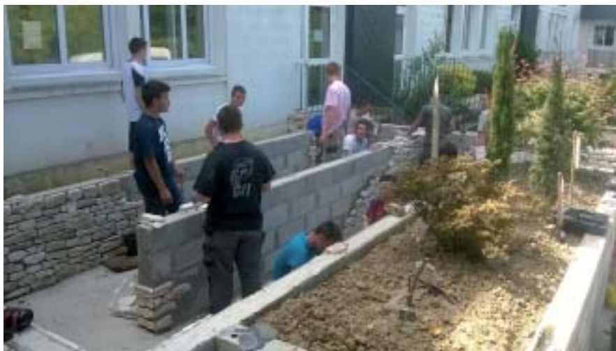
Une rampe pour personnes à mobilité réduite.

- Bonjour, je m'appelle Teuse et moi Sonneuse. - Je suis inspecteur des travaux finis, est ce que vous pourriez répondre à mes questions? - Oui, pas de sushi, je suis à votre disposition - Que faites vous ici? qu'est ce tout ce chantier? - Nous sommes en cours de construction d'une rampe pour donner l'accès aux personnes à mobilité réduite. - Mobilité réduite, c'est quoi ça, des trottinettes? Mais non, enfin, ce sont des personnes en fauteuil roulant ou ayant des difficultés pour monter les marches. - Et vous ne pouviez pas faire une rampe toute droite au lieu de faire des zigs-zags ça fait trop long, on dirait un circuit de formule 1. - Mais, n'importe quoi, vous êtes bien un inspecteur des travaux finis vous! il faut res-