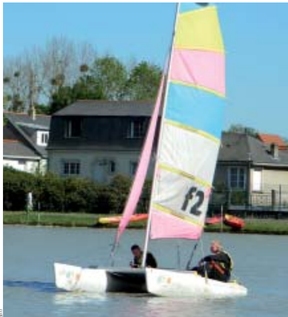
Les élèves de 2 de agricole initiés à la voile.

En partenariat avec la Ligue de voile des Pays de la Loire, la MFR