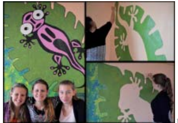
Le foyer prend des couleurs.

Durant un séjour à la MFR, trois élèves de Gée ont réalisé une peinture dans leur foyer représentant deux salamandres.