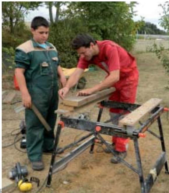
Les jeunes travaillent le bois destiné à la maison aux insectes.

La construction du premier hôtel à insectes à la Rousselière va être assurée, cette année, par les jeunes du dispositif DIMA (Dispositif d'Initiation aux métiers en Alternance). En effet, cette formation fait partie intégrante du centre de formation la Rousselière. L'objectif, pour ces jeunes, est de parfaire leur orientation et de trouver un apprentissage. La Rousselière propose à ces jeunes, en plus des stages en entreprise, divers ateliers dont la mécanique, la