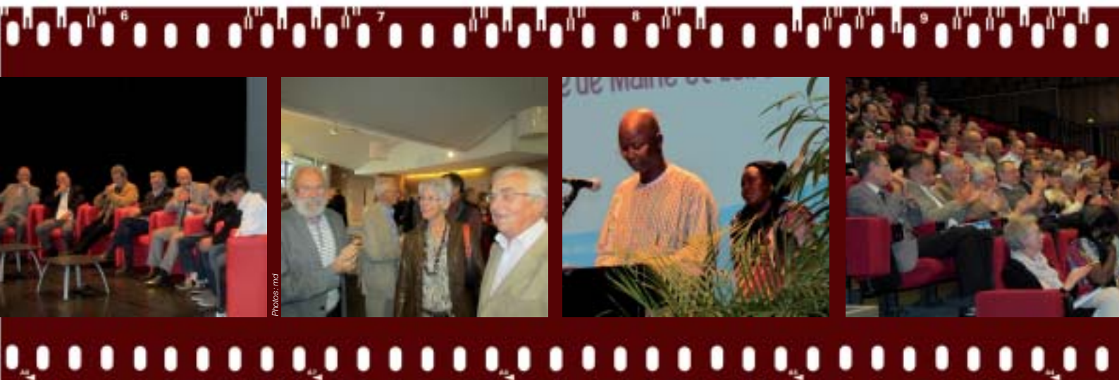
Quelques temps forts de la matinée en image : table ronde associant les premiers élèves et les plus jeunes, des retrouvailles appréciées, la présence des responsables des MFR du Burkina Faso, une assemblée conquise par les jeunes talents.