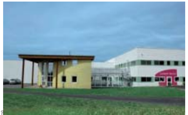
L'entreprise Comptoir des Lys.

Connaissez-vous Coslys ? Oui. Etamine du Lys ? Encore oui. Capt'hygiène, Preserve, if you care. ? Un peu moins ! Et pourtant, tous ces produits sont de la même entreprise : Comptoir des Lys.