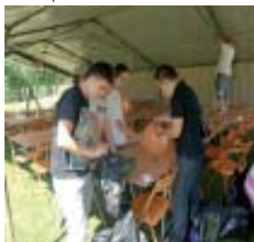
Les quatrièmes mobilisés

et chaises, gonflage des ballons, décoration des tentes... « Cela nous a permis de parler avec les membres du CA, l'ambiance était très sympa et décontractée ».