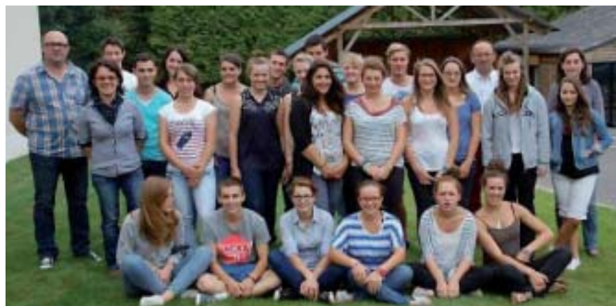
Les terminales ont découvert la Finlande et l'Angleterre.

Les Terminales Bac Pro CGEH - MFR Pouancé.