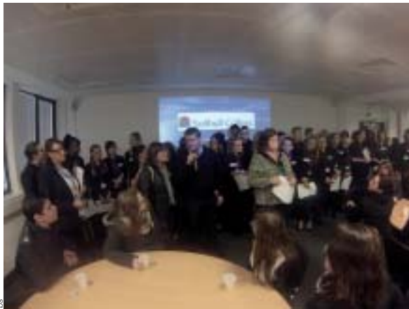
Moment convivial dans un établissement scolaire de Solihull.

Dans le cadre du jumelage Cholet-Solihull, cent-dix élèves de Seconde Bac Pro, CAP et CAPA de la MFR-CFA La Bonnauderie ont traversé la Manche en novembre pour un séjour d'une semaine en terre anglaise. Ils ont eu l'occasion, pour la plupart, d'appréhender pour la première fois « the British Way of Life » et de découvrir un autre univers professionnel au travers de visites centrées sur leurs supports-métiers respectifs.