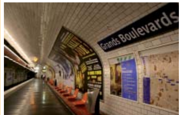
Paris à 100 à l'heure !

Terminales Bac Pro Commerce, MFR de Segré.