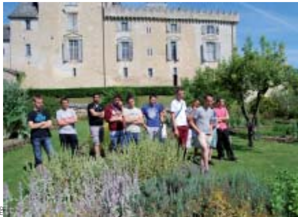
Jardins, tauromachie, dune du Pilat. Quel programme !

La classe de Première Bac Professionnel « Aménagements Paysagers » de la MFR de Beaupréau a réalisé son voyage d'étude à Dax, dans les Landes, en juin 2014.