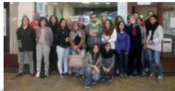
The Family Café: notre QG pendant ce séjour.

Rentrée pas comme les autres pour les élèves de Terminale Bac Pro « Canin et Félin » de la MFR de Champigné. Tout de suite, direction l'Angleterre pour un stage professionnel.