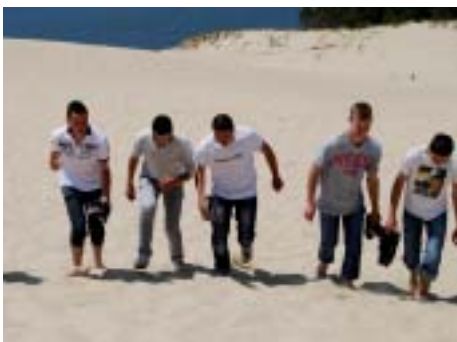
Dur, dur de monter au Pilat