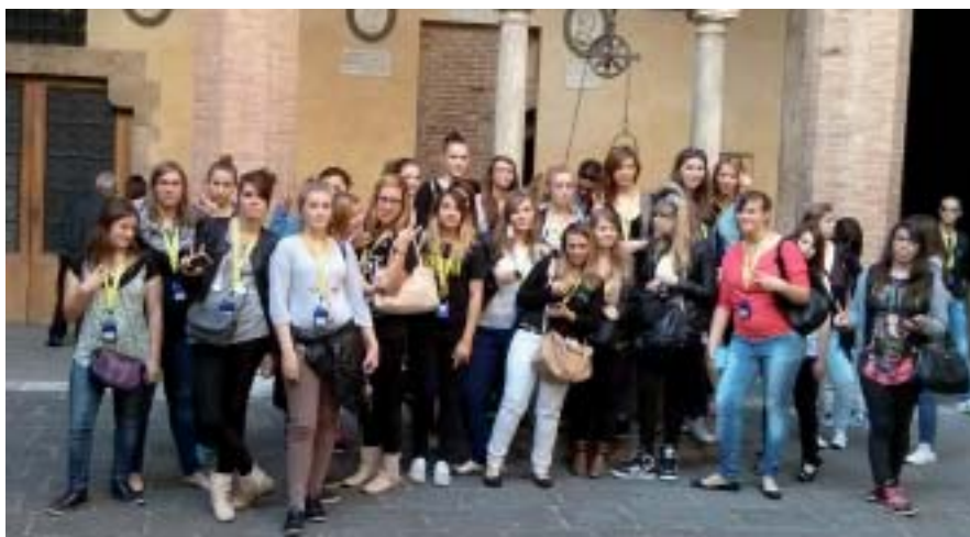
Les Terminales ont découvert Florence, Arezzo, Féliné.

Le 3 octobre dernier, les Terminales de la Maison Familiale la Riffaudière à Doué-la-Fontaine ont pris le car direction l'Italie pour une durée de quinze jours. Non pour un séjour touristique mais pour un stage professionnel dans le cadre de leur formation Bac Pro SAPAT (service aux personnes et aux territoires).