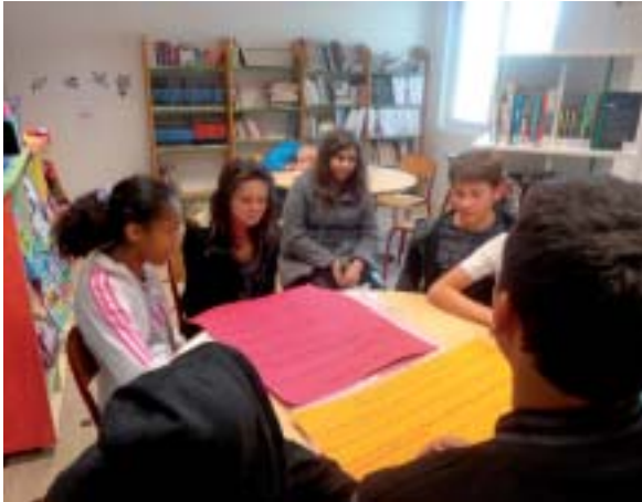
Les moins de 14 ans en réunion de rédaction.

À la MFR « La Riffaudière » de Doué-La-Fontaine, les jeunes ont créé un journal avec des rubriques variées : loisirs, cuisine, secteurs professionnels,... À la fois, pouvant les intéresser mais aussi pour plaire à leurs lecteurs.