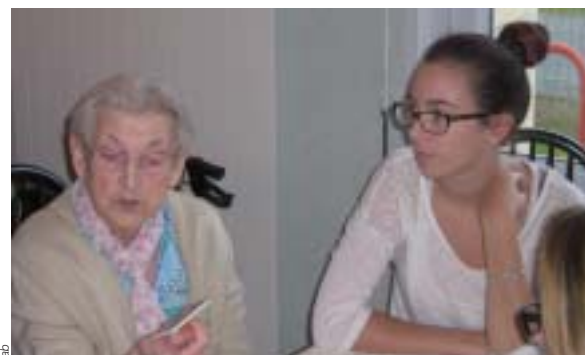
Echange d'une élève de CAPA 2 avec une personne âgée.

Les CAPA 2 de la MFR « La Bonnauderie » à Cholet ont visité, le 8 octobre dernier, la résidence Montana, du groupe Steva. Cette chaîne, non médicalisée, est reconnue en France.