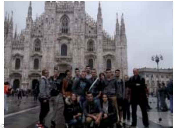
Le groupe en visite au Duomo de Milan.