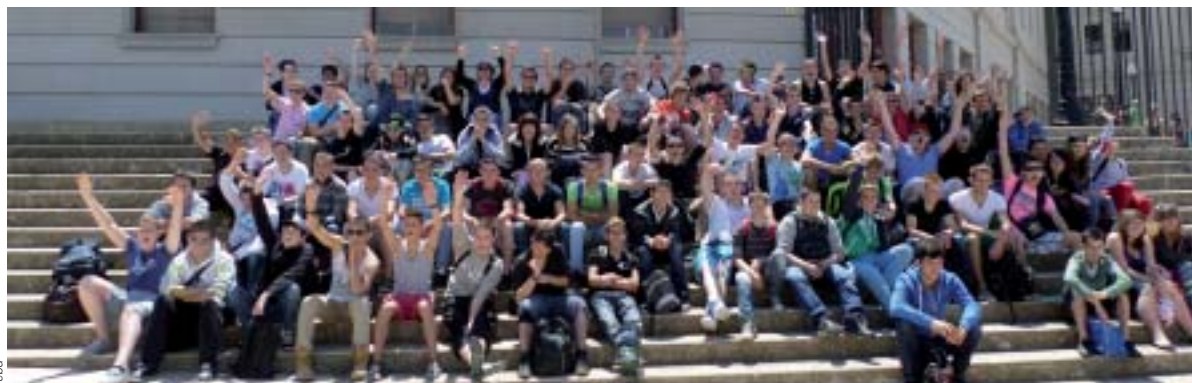
Visite du stade olympique de Barcelone, pour rallumer la flamme.

Les élèves de Seconde Pro MFR Chalonnes sur Loire