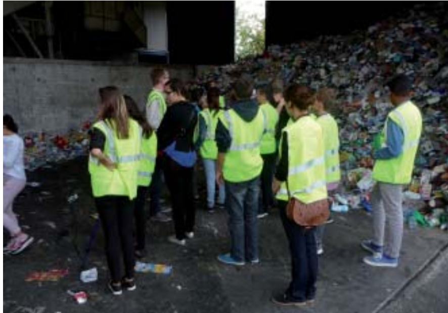
Les élèves visitent le Centre de Tri de Dampierre-Sur-Loire.

Pour compléter cette intervention, les élèves se sont rendus au Centre de tri de Dampierre-Sur-Loire. Sur place, équipés d'un gilet jaune pour assurer leur sécurité au milieu des engins, ils ont découvert le site. Ils ont pu observer les lignes de tri manuel sur lesquelles les agents effectuent le tri des déchets selon leur catégorie. Ils ont été impressionnés par les tapis roulants qui transportent les matières vers des casiers différents en fonction de leur nature. Les déchets