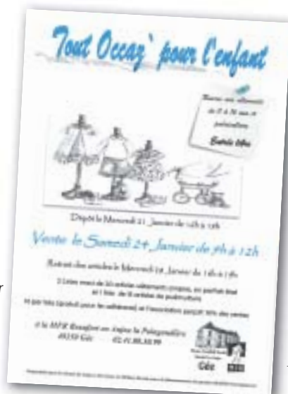
« Tout occaz'pour l'enfant » affiche réalisée par les élèves.