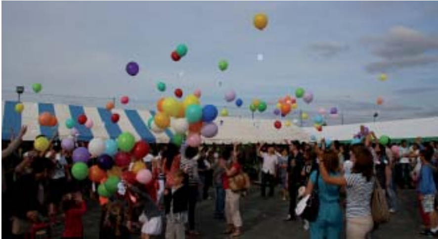
Le lâcher de ballons : moment festif, toujours apprécié.