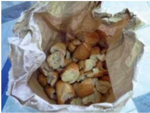
Gaspillage alimentaire : celui du pain est facile à enrailer.

C'est ainsi que, le mardi 4 novembre, les élèves de la MFR de la Saillerie et du Cèdre, se sont retrouvés pour voir le film « Food Savers » de Valentin