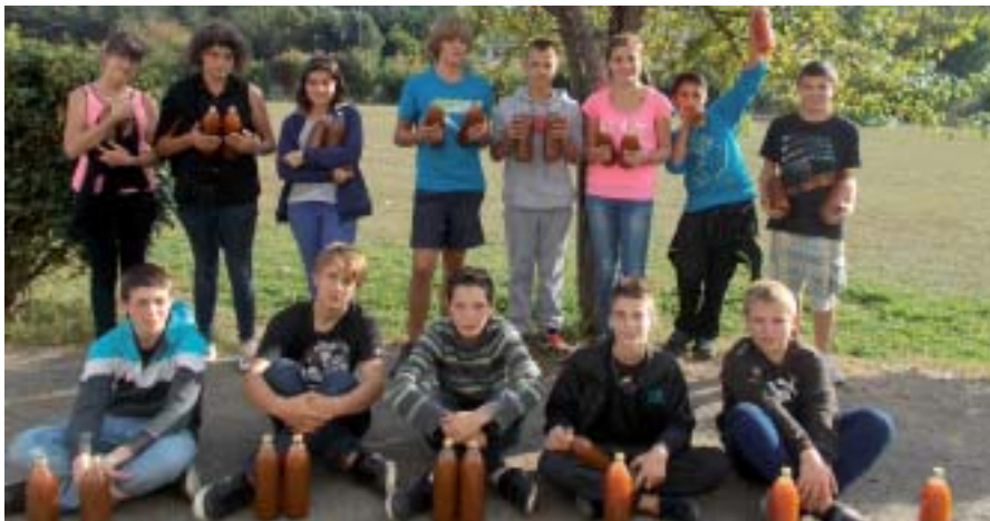
Tous réunis avec leur jus de pommes.

Les jeunes des MFR de Segré, Pouancé et Champigné.