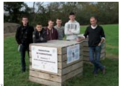
De nombreux projets seront présentés au forum Eco-citoyen en avril 2015.