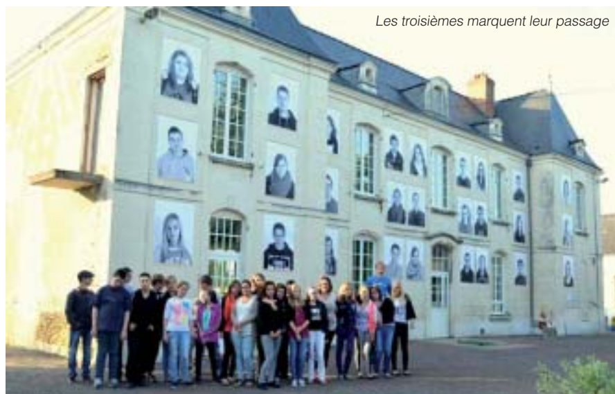
Les troisièmes marquent leur passage