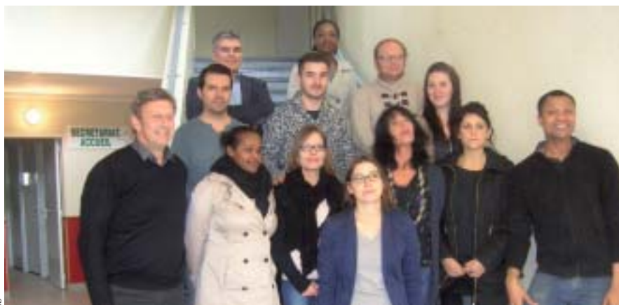
Les stagiaires BTS Hôtellerie Restauration au retour de la visite à l'hôtel Ibis Styles.

Douze adultes œuvrent donc à la préparation de cet examen de l'éducation nationale dont les épreuves se dérouleront à partir de mai 2015.