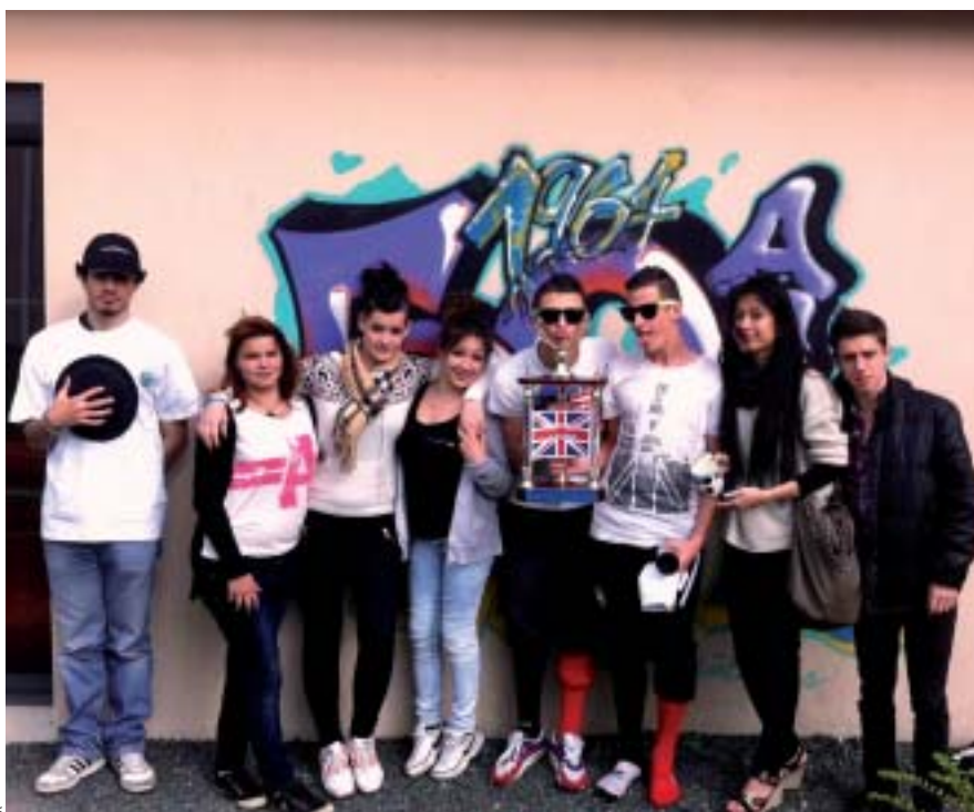
Les lauréats du concours devant la fresque réalisée pour le 50 e anniversaire de la MFR.