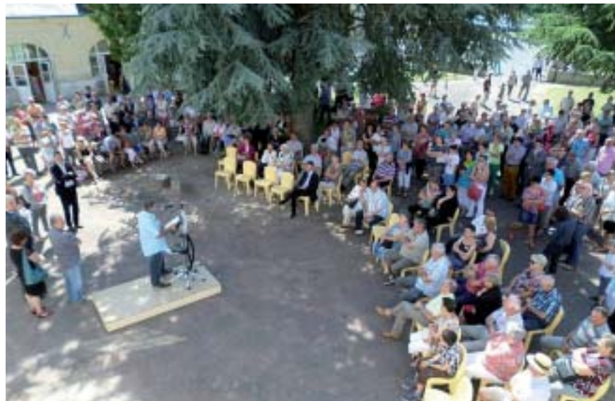
Ouverture de la cérémonie