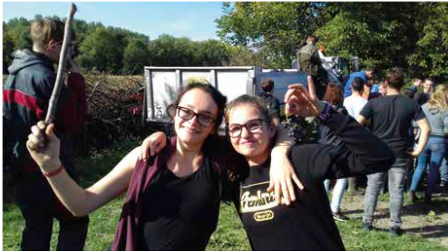
Même au travail, la bonne humeur est communicative.