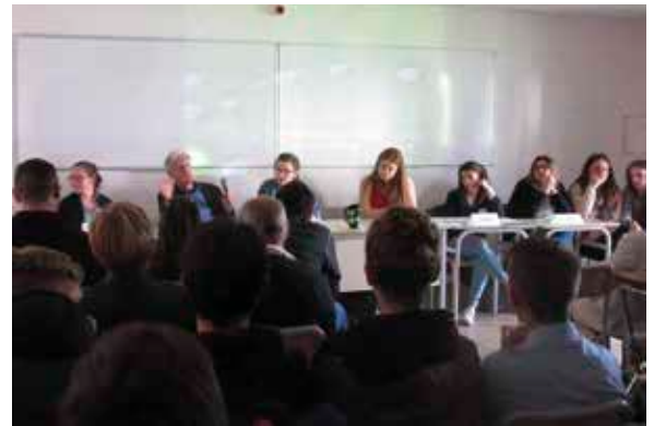
Débats intenses et riches d'enseignements.

Les groupes thématiques devaient proposer un condensé de leurs recherches. Ils ont travaillé avec une bénévole qui est venue les aider à organiser la restitution sous forme de conférence. Le démarrage a été assez long puis les élèves se sont vraiment bien investis, soucieux de proposer à l'auditoire un exposé compréhensible et intéressant.