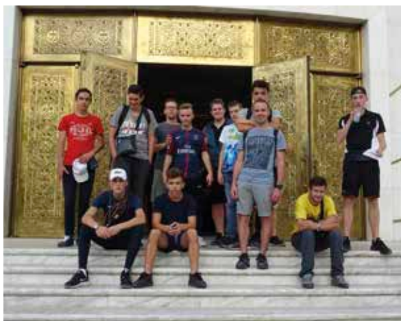
Les apprentis deuxième année devant la cathédrale orthodoxe de Tirana, capitale de l'Albanie.

La classe de CAP2 de la MFR/CFA de Champigné.