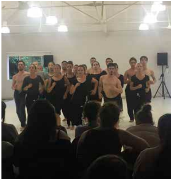
Les danseurs du CNDC en pleine répétition.

Léa M., 1 re Bac pro SAPAT MFR Saint-Barthélemy-d'Anjou.