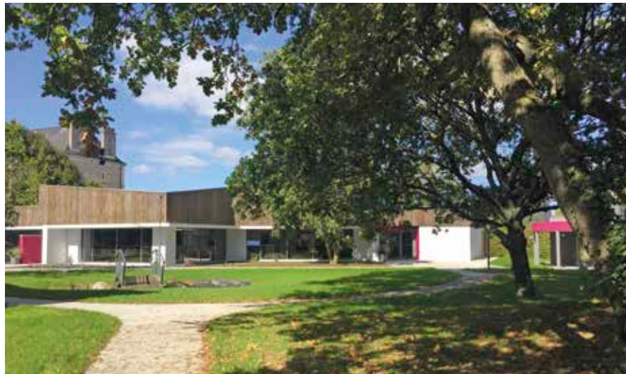
Un environnement de qualité pour passer un moment de convivialité ...

Wendy et Romain, Terminale BAC PRO SAPAT, MFR Le Cèdre - Saint-Barthélemy-d'Anjou.