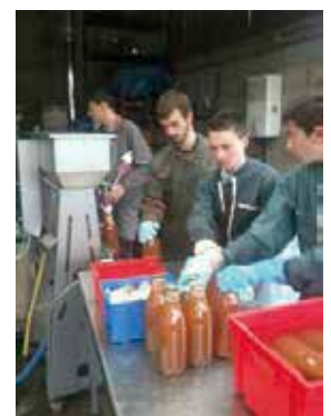
Les jeunes de la MFR de Chemillé fabriquent du jus de pommes, bu en partie lors de la rencontre citoyenne le 22 février.

Pour la convivialité de tous, un goûter confectionné par les MFR sera partagé avec dégustation de jus de pommes réalisé