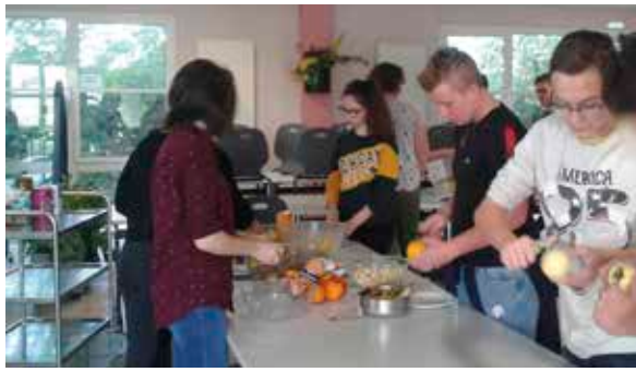
Les jeunes de 4 e /3 e en atelier cuisine.

Une exposition de cucurbitacées a décoré le self de la MFR pendant la semaine. « On a découvert le nom de certaines » ont fait remarquer les jeunes. En parallèle, un concours intitulé « Un plat presque parfait » a été proposé aux jeunes et à l'équipe. Chacun pouvait réa-