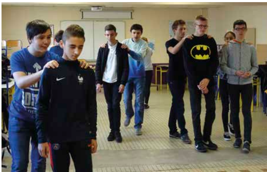
Faire confiance pour mieux communiquer.