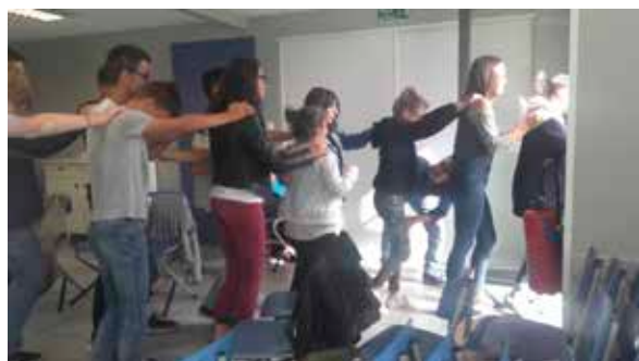
Découverte de la MFR en « chenille » : un moyen de transport sûr et convivial.

Aller vers les autres lorsque l'on intègre un nouvel établissement, ce n'est pas facile. Pas plus en 4 e que dans les autres classes. À la MFR Le Vallon, c'est le collectif Côté Cour qui vient nous apporter un peu de ciment pour créer une cohésion entre élèves d'un nouveau groupe. En 4 e , cette année, tout le monde se prête aux mises en situations et jeux, guidés par les deux intervenants. Prise de parole, contact physique et expression des émotions forment un cocktail idéal pour mieux se connaître et oser. Tout le monde a pris joyeusement part à ces ateliers, tantôt en grand groupe