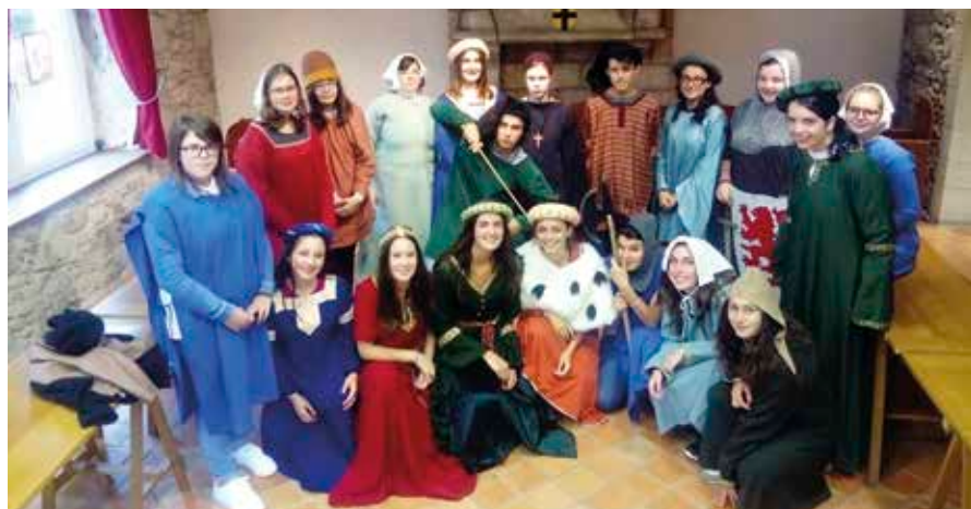
Les élèves prêts à effectuer leurs jeux de rôles.

La classe de Seconde SAPAT - MFR La Romagne.