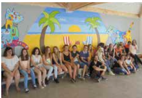
A la MFR de Champigné, les élèves de Seconde présentent leur œuvre d'art.