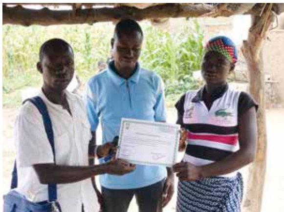
Remise d'attestation de formation en électricité bâtiment à une stagiaire de la MFR de Diabo.

Mais son rôle ne s'arrête pas là ! En effet, elle dynamise le réseau naissant de ces douze associations en formant ensemble les administrateurs nationaux, en professionnalisant les moni-