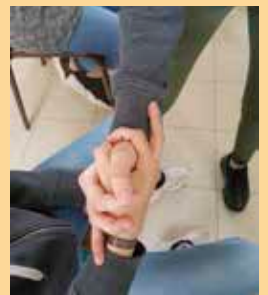
Le toucher caresse.

L'Humanitude est parfaitement reconnue au Japon. La JST, Japan Science and Technology, lui a accordé en 2017 une subvention nationale par l'intermédiaire de sa division de recherche stratégique et l'a classée en recherche fondamentale pour la science de l'évolution et la technologie.