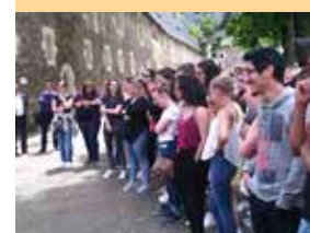
Sourire sur les visages : les animateurs racontent, avec humour, la vie au château.