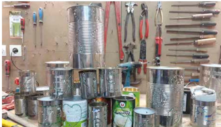
La fabrication des lampions.