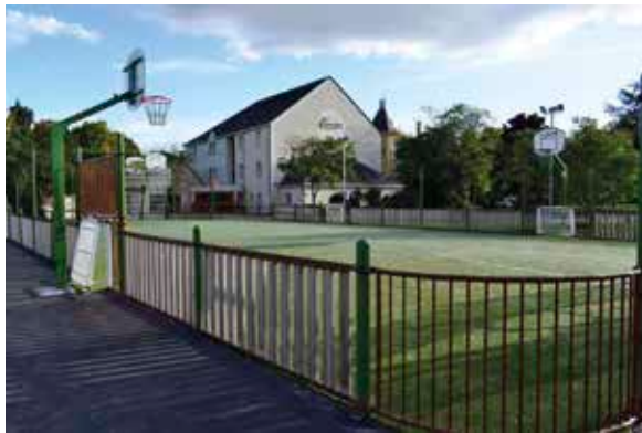
Un city stade à disposition des apprentis.

Le city stade est un outil sportif et éducatif par excellence. Cette structure multi-sports