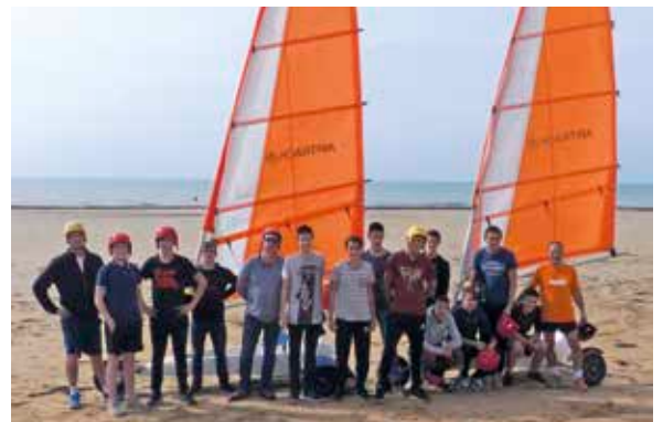
Rentrée sportive pour les apprentis mécaniciens.

Les apprentis de la MFR-CFA 'La Rousselière' ont profité des belles journées ensoleillées de septembre pour découvrir la Vendée. Le séjour d'intégration des jeunes leur a permis de découvrir le musée de l'automobile de Vendée et l'entreprise « La Mie caline ». Les jeunes se sont également initiés à plusieurs activités sportives en particulier le char à voile sur le littoral atlantique. Cette activité nouvelle pour de nombreux apprentis a permis de lier connaissance et de s'organiser pour réussir à trouver le vent nécessaire afin de rouler sur les plages. Les apprentis ont fait preuve de débrouillardise et