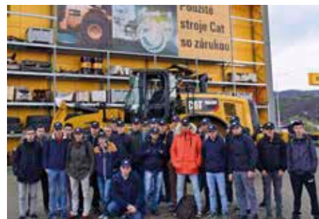
À la MFR La Rousselière, les jeunes en 1 re Baccalauréat Professionnel Conduite et Gestion de l'Exploitation Agricole à dominante cultures ont pu découvrir les différents matériels agricoles lors de mobilité européenne.