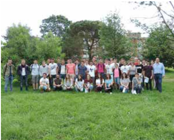
Les étudiants français et italiens à l'Institut Bonfantini à Novara (Italie)

Au retour, le voyage a fait l'objet, en octobre, d'une évaluation ainsi que d'une restitution devant les parents et les maîtres d'apprentissage.