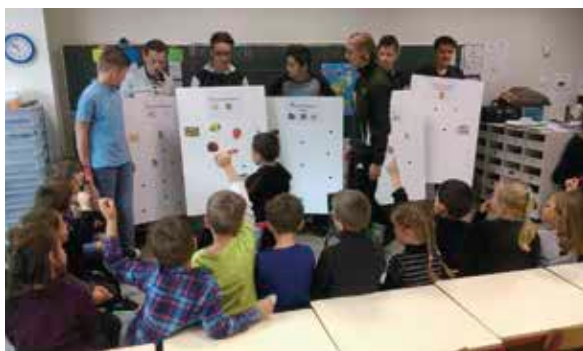
L'atelier « groupes alimentaires » en pleine action.

Vendredi 13 octobre, les élèves de 3 e de la MFR La Sablonnière de Brissac-Quincé sont allés à l'école maternelle Les Jardins pour réaliser leur projet en EPI (Enseignement Pratique Interdisciplinaire) Restauration.