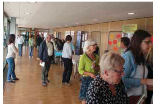
Accueil et bien-être au Salon des Aînés.

Le 29 septembre 2017, les communes de Saint-Clément-de-la-Place et Longuenée-en-Anjou ont organisé pour la première fois un salon dédié aux Aînés en partenariat avec le CLIC Outre Maine. Cet événement permettait aux aînés et à leurs aidants de participer à différentes conférences animées par des professionnels : « Bien manger, bien bouger et bien vieillir », « Adapter son logement » et « bien prendre soin de sa santé visuelle et auditive ». De nombreux partenaires (ASSPA Santé, Résidence Val de l'Isle, ADMR, ESSILOR) ont répondu aux demandes des participants.