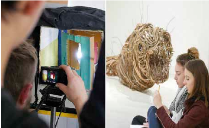
De la découverte à la création.

Pour la première étape du projet, les élèves ont visité le musée Joseph Denais. Ils ont découvert l'exposition temporaire de l'artiste Lionel Sabatté. C'est une exposition de sculptures et de peintures sur toile. Il sculpte à l'aide de matériaux sans valeur comme de la pousière, des cheveux, des pièces de un centime, des ongles, des tiges de fer filettées, du béton... À travers ses œuvres, Lionel