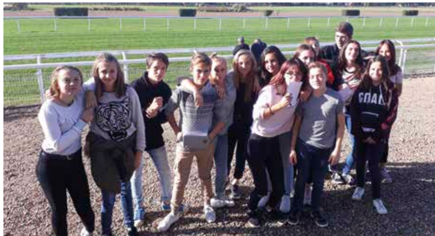
La classe de troisième devant l'hippodrome.