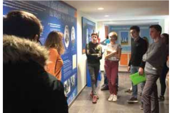
Découverte d'un centre de traitement des déchets.