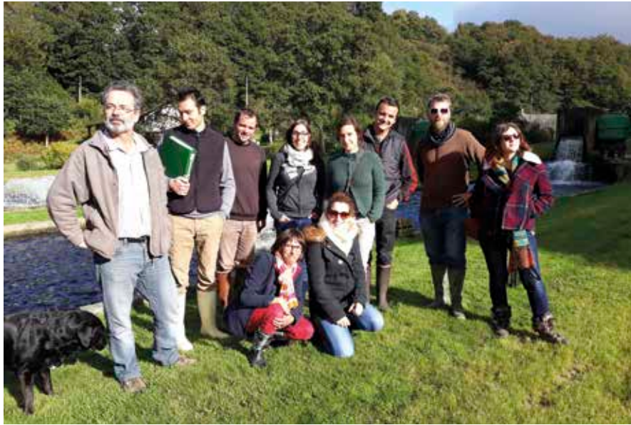
Le groupe CQP vendeur conseil en produits bio en visite en Bretagne.

Comme chaque année en fin de formation, ils partent en visite d'entreprises pour mieux appréhender la filière biologique. Cette fois, ils sont partis en Bretagne pour découvrir les algues, les poissons et la transformation des céréales. En effet, nous avons eu la chance d'être reçus dans l'entreprise 'Bord à Bord', leader dans la commercialisation des algues alimentaires. Cette entreprise située à Roscoff nous a présenté la récolte et la trans-