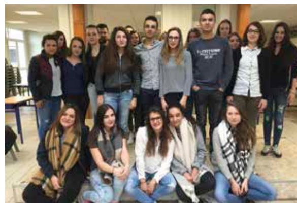
Les Bac Pro ont posé pour la photo.

Pendant leur année de première en Bac Pro CGEH (Conduite et Gestion d'une Entreprise Hippique), les élèves ont réalisé et joué une pièce de théâtre intitulée 'Roméo et Juliette' de Shakespeare.