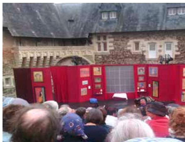
En attendant l'entrée des artistes puisque, après, nous ne pouvions plus prendre de photos.