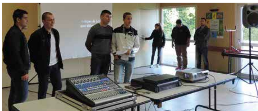
Présentation de la soirée débat par les jeunes.

Durant les heures de cours avec le soutien de Manuela. Elle connaissait une personne qui avait réalisé un film avec des collégiens sur le sujet. Dans ce film, il est question d'un jeune collégien qui, peu à peu, se fait harceler en allant au collège. Sa famille ne voit rien venir... Il finit par se suicider. Concernant ce film, on a voulu le montrer aux jeunes de la MFR pour les sensibiliser et, aussi, aux adultes (formateurs,